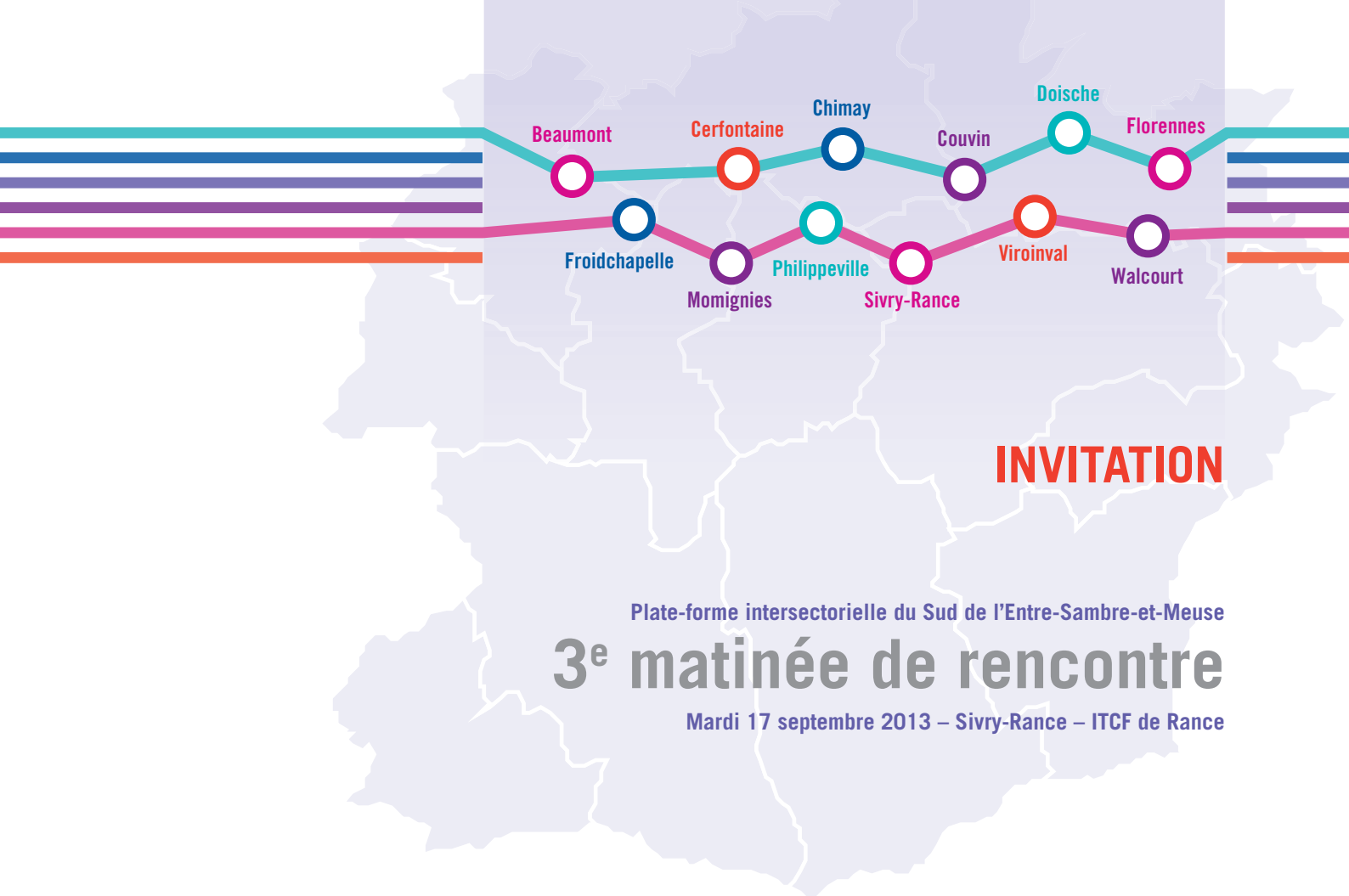
Plate-forme intersectorielle du Sud de l'Entre-Sambre-et-Meuse 3 e matinée de rencontre

Mardi 17 septembre 2013 – Sivry-Rance – ITCF de Rance